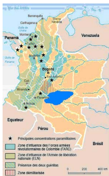
Mapa 1. Zonas de intervención