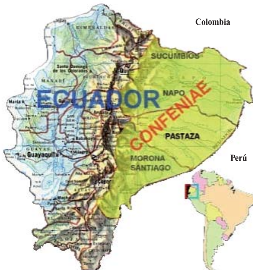
Mapa 2. Pueblos indígenas en Ecuador