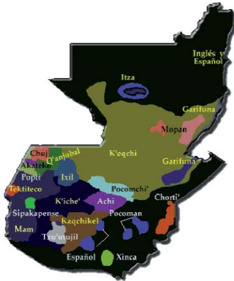
Mapa 3. Identificación de los colectivos indígenas en Guatemala