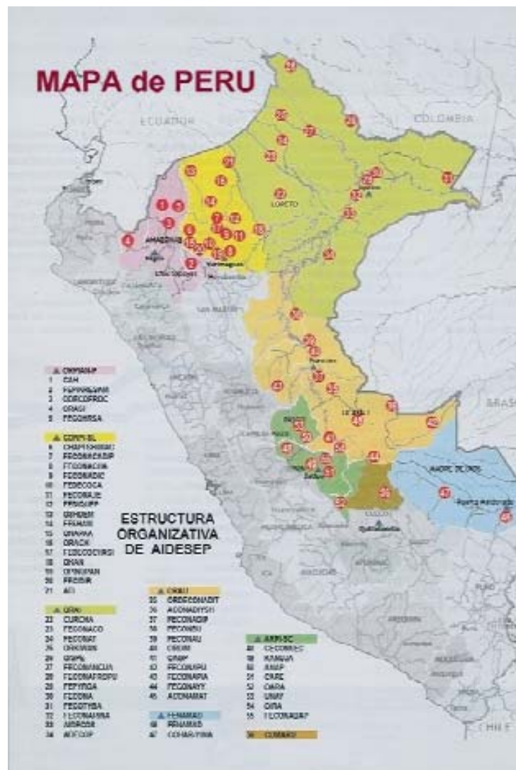
Mapa 5. Organizaciones y pueblos pertenecientes a AIDSESP